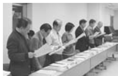
推進責任者連絡協議会で子育て憲章を唱和