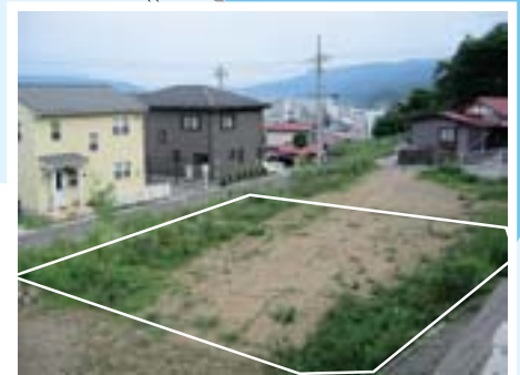
①山手町二丁目分譲地