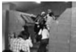
△リサイクル工場見学の様子