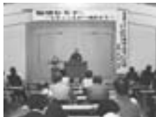
△環境セミナーの様子