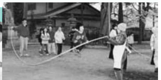
大人と子どもの交流