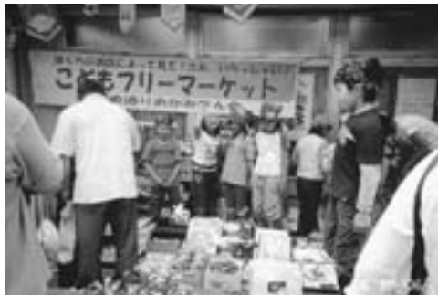
こどもフリーマーケット