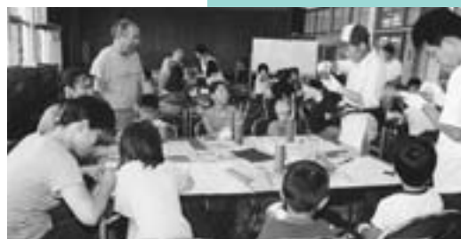
文化の伝承 竹細工作り