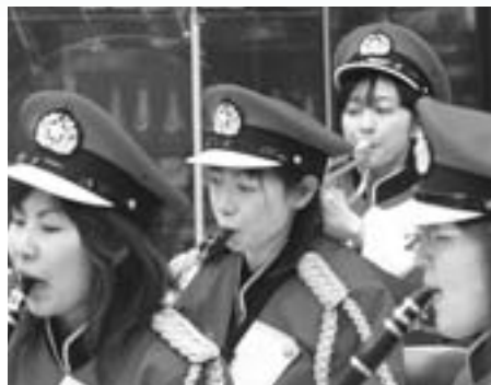
防災ふれあいコンサート