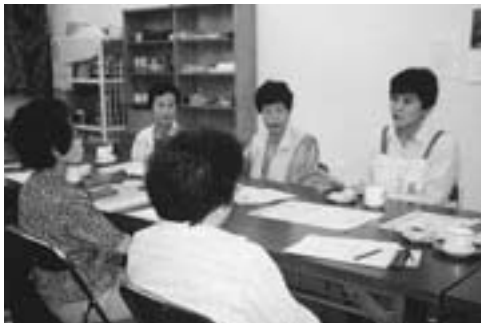
市民の会員と話し合い