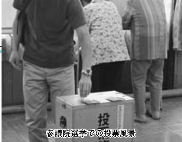
参議院選挙での投票風景