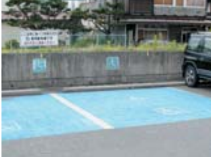
▲現在の西口ロータリー駐車場