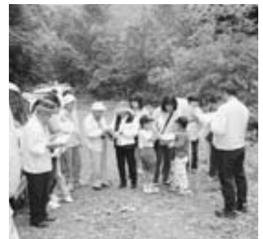
▲横河川上流域を見学する参加者(昨年のように)