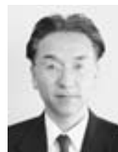
副議長 渡辺 太郎