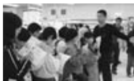
△市内店舗での環境に配慮した取り組みの見学会（岡谷こどもエコクラブ「スーパー探検」）

経済性、利便性の追及だけでなく、環境に充分配慮した快適で潤いのあるまちづくりに努めます。