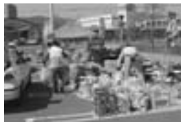
△サンデーリサイクルデーでの資源物回収の様子