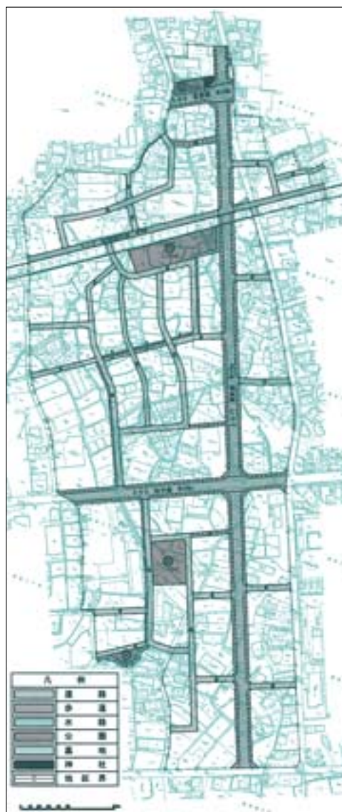
まちづくり計画図

一人でも多くの明確な賛成をいただき事業を推進していきたいと考えています。この事業は第3次総合計画に位置づけ取り組んでおり、重要な事業です。アンケートの結果賛成70%以上に達しましたら、より以上のご理解を得られるよう最善の努力をしながら、しっかり取り組んでいきます。市民のみなさんには引き続きこの事業に対してのご理解をお願いします。