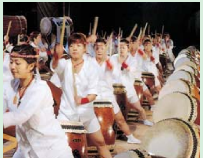
▲響け! 大和撫子の心意気