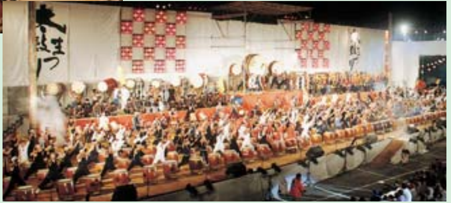
▲勇壮な300人揃い打ちは夏の夜空に轟きました