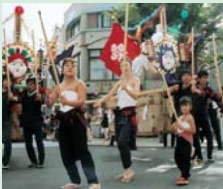
▲ワタシもがんばるわよ