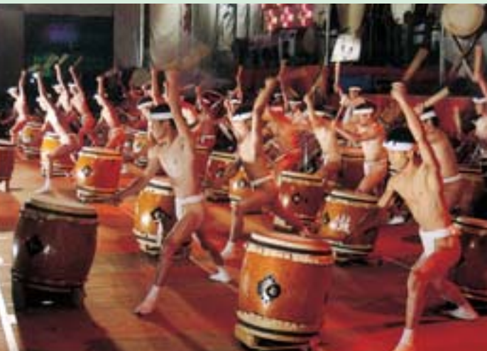
▲男達の魂の叫び「炎群」