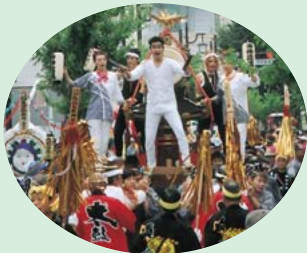
▲ソレ、ワッショイ、ワッショイ