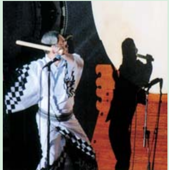
▲林市長の砂切太鼓