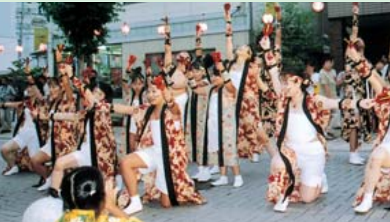
▲みんなこい勤青 MINAKOIわっさか大賞に輝いた2チーム ▼中川天龍振興会