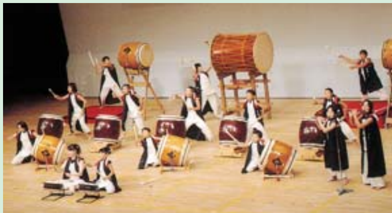
▲第5回世界和太鼓打ち比ベコンテスト 文部科学大臣奨励賞の「こころ会輪太鼓純じゅにあ」