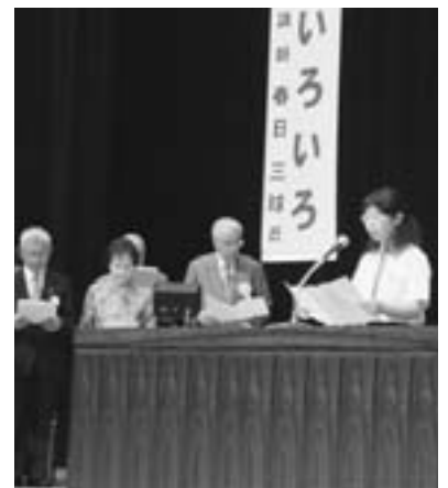
岡谷市民憲章唱和