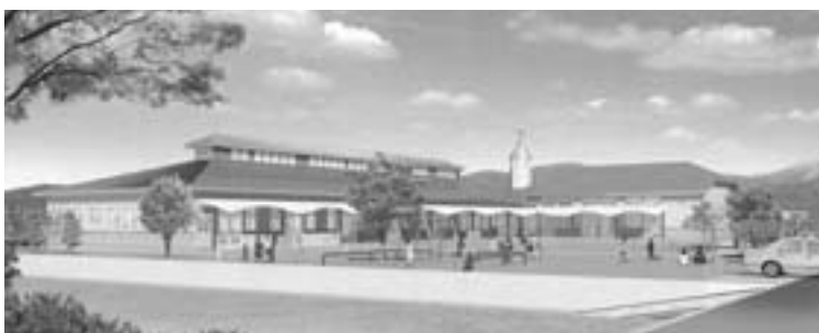
(仮称)湊保育園建築工事 完成予想図

▽平成16年度一般会計で、水泳プール事故に関わり、特別職(市長・助役・収入役)の給与を5万8千円減額し、総額23億9971万円とすることを決めました。