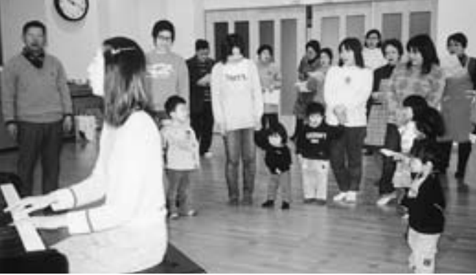
▲みんなで歌をうたきましょう (下浜キッズ21)