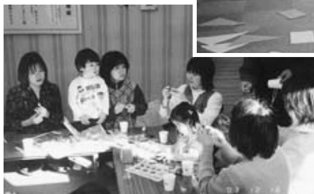
新倉区「乳幼児親子ふれあいの集い」