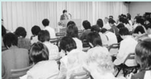
▲中屋区の事例発表後、17グループに分かれ班討議が行われました