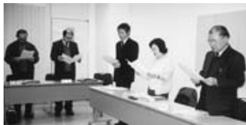
▲推進責任者連絡協議会で子育て憲章唱和 〈敬称略〉

区長さんから推薦された方々で、地域子(己)育てミニ集会推進にあたります。常に中心者と連絡をとって、中心者のよき相談相手になります。また、地区の推進を図るとともに市と地区との連絡調整にあたります。