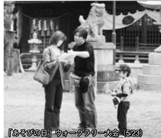
『あそびの日』ウォークラリー大会 (5/23)