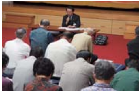
一番人気のある「市町村合併」講座のようす (6/8今井区)