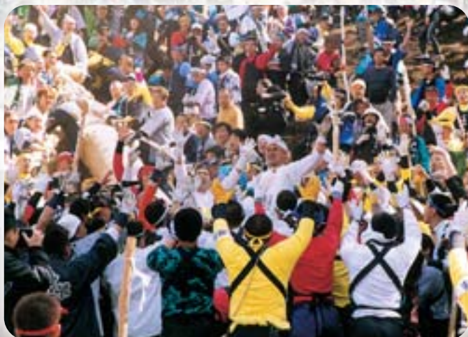
木落とし坂を乗り切り歓喜のひとつき