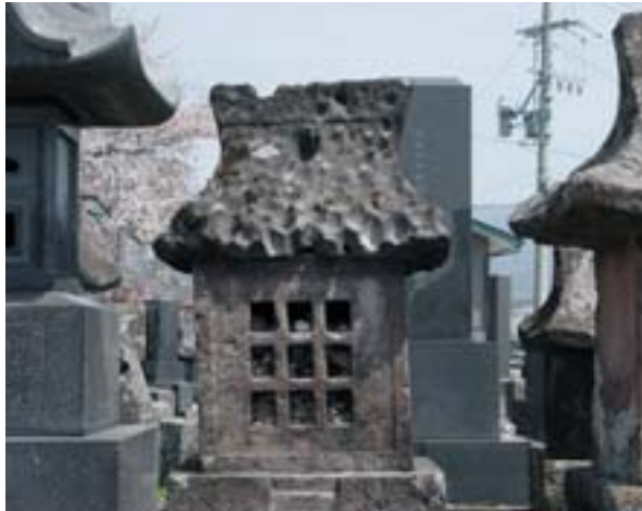
長地線「長地中央薬局」下車

お礼参りには石を倍にして返したそうです。また、屋根を削り煎じて飲む人もいたそうです。そのため藍塔の中にはたくさんのお石があり、屋根は窪みだらけになっています。昭和42年、岡谷市の史跡に指定されています。