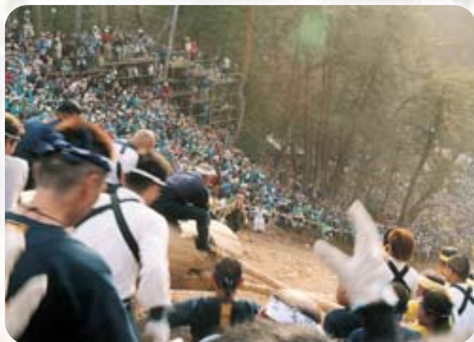
「いざっ」その瞬間です