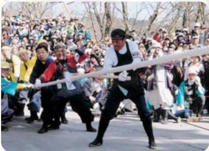
追掛綱を「ズバツ」と