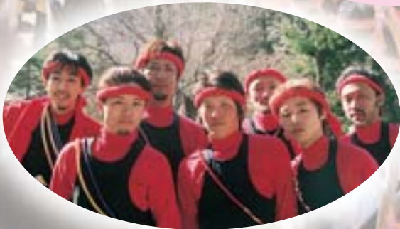
気合い十分の若衆