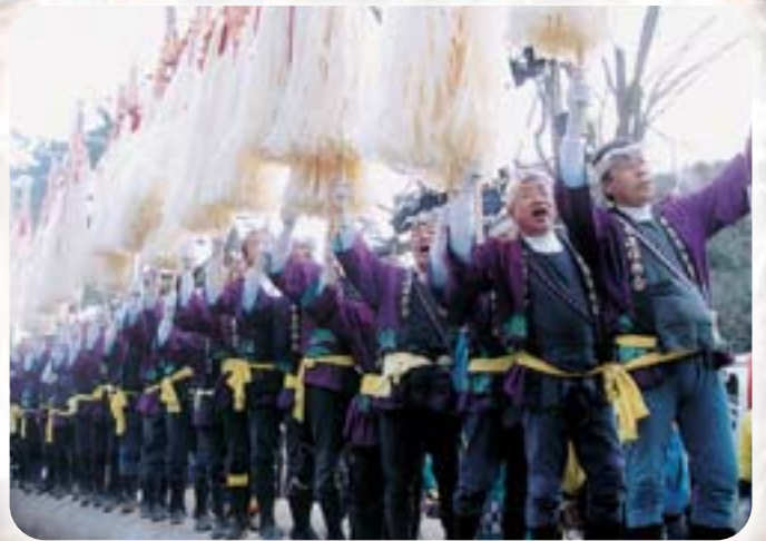
木遣り衆の音が響き渡り、さあ、いよいよです