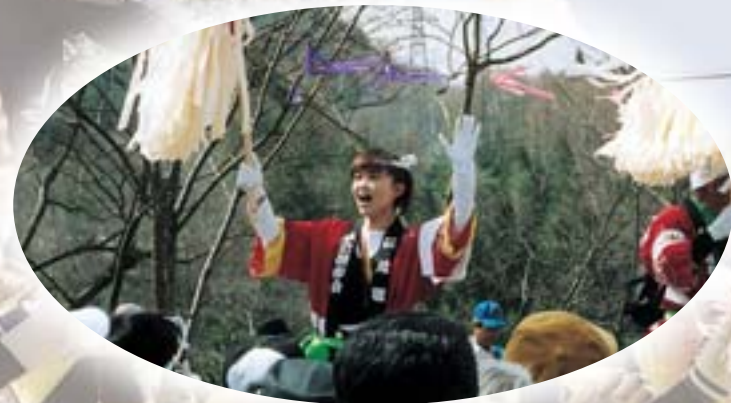
「ここは木落とし、お願〜いだ〜あ」