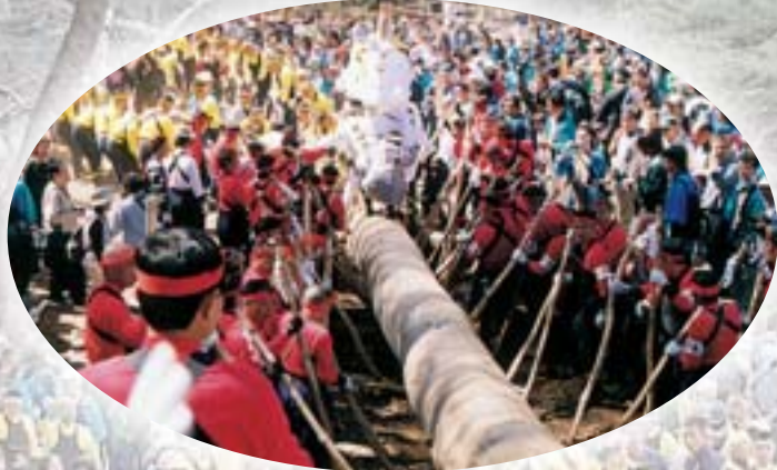
さあ、ここが腕の見せ処「よいてこしょ、よいてこしょ」