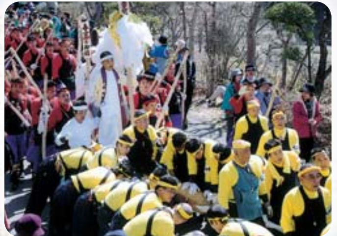
「ヨイサー、ヨイサー」力をあわせて曳行中の春宮四