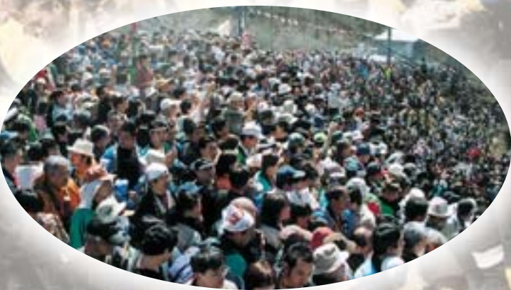
一目木落とし坂を見ようと群集が押寄せました