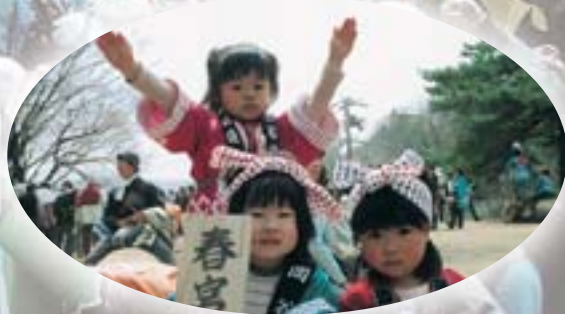
「私たちがもいくわよ〜」