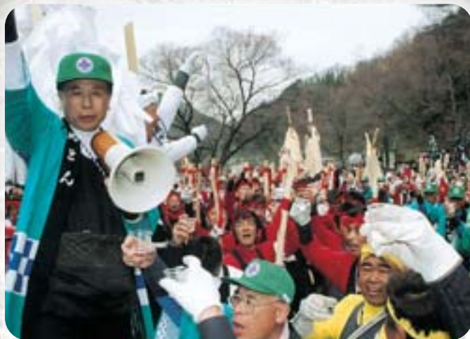
無事に注連掛（しめかけ）まで曳きつけ乾杯です