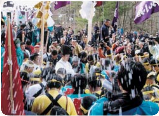
春宮三の綱渡り神事