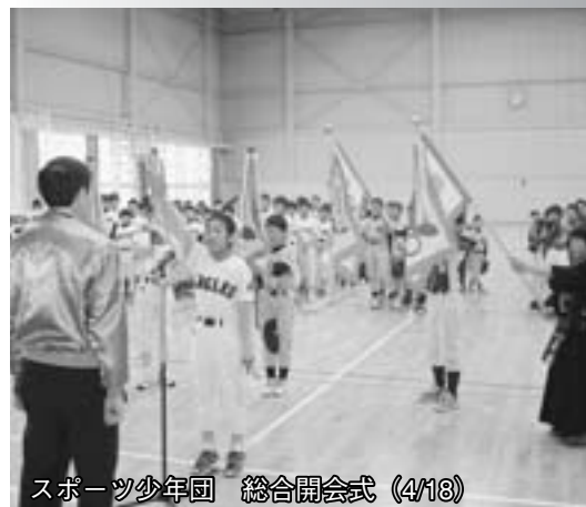
スポーツ少年団 総合開会式(4/18)

※平成16年度岡谷市教育委員会主催ローラースケート教室受講者は、自動的に 大会出場となりますので申し込みは不要です。