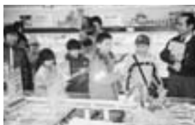
スーパーマーケットでの環境保全への取組みを学習中（岡谷こどもエコクラブスーパー探検にて）