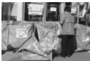
市内店舗での資源物分別回収の様子

市民一人ひとりが環境の現状を認識し、環境の保全に関する知識を身につけ、自主的な活動を推進します。