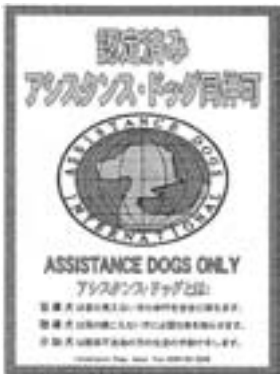
（補助犬同伴可ステッカー）

そのようなわけで、聴導犬の場合は、人に親しんで欲しいので、一般の人にも声を掛けてもらったり、撫でてもらうだけでもいいそうです。