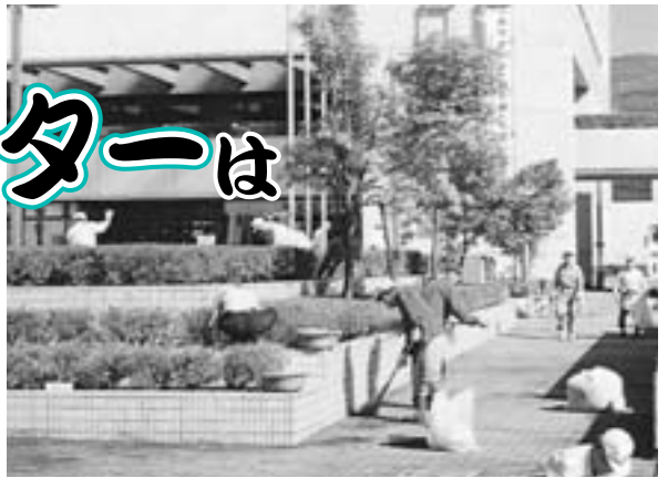
社会奉仕活動のようす