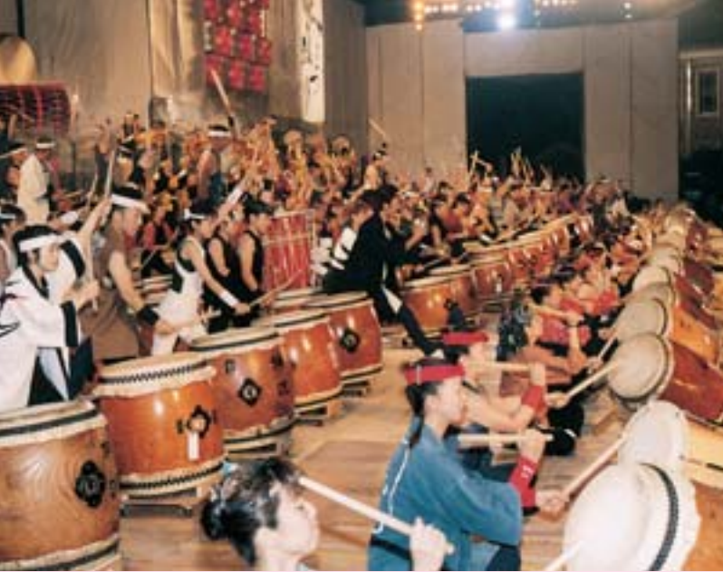
▲勇壮な300人揃い打ち