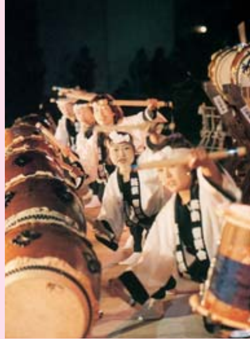
▲岡谷太鼓打ち比べ大会 そら 揃い打ち曲 アレンジ部門最優秀賞「鼓楽響楽舎」