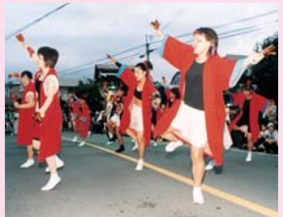
▲ソーラン!ソーラン!