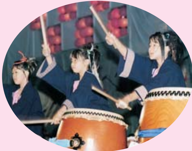
▼▲子どもたちも威勢よく