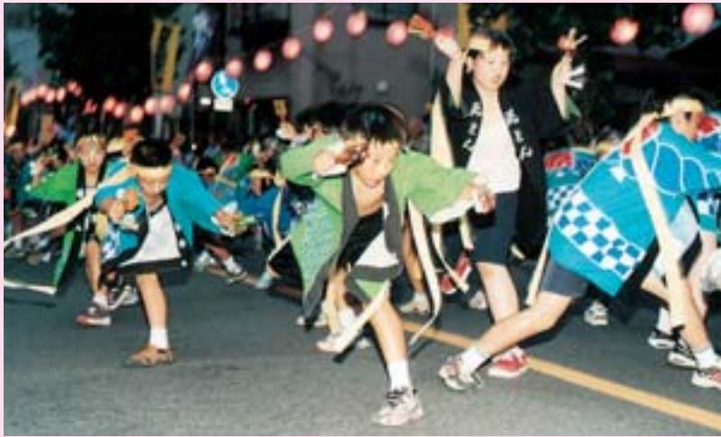
▲MINAKOIわっさか大賞「2003 小井川小五年隊」