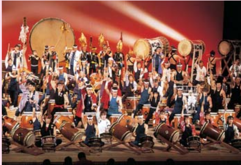
▲▼2日目、雨のためメインステージはカノラホールで行われましたが、つめかけた大勢の観客のみなさんは熱気ある揃い打ちに魅了されていました。