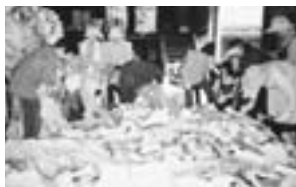
消費者の会牛乳パック回収