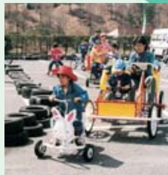
㉕おもしろ自転車 子どもから大人まで楽しめる変わり種の自転車

問合せ 鳥居平やまびこ公園管理事務所 ☎22-6313 ㊚23-9451 http://www.lcv.ne.jp/~yamabiko/