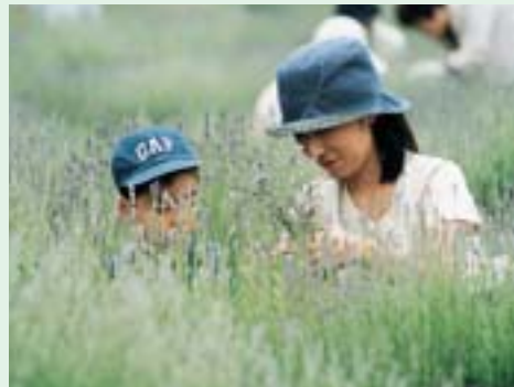
4 ラベンダー園 摘み取りと香りが楽しめるラベンダー園