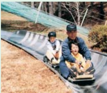
⑫サマーボブスレー 延長659m、落差18mのスピードを楽しむ林間コース