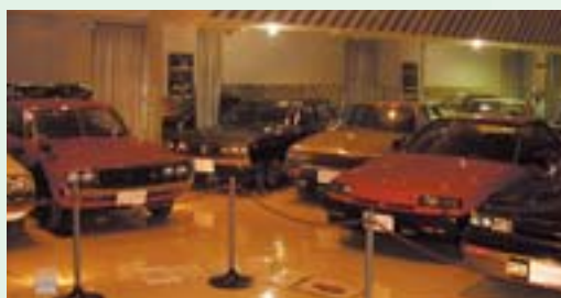
⑨スカイラインミュージアム(センターハウス内) 歴代のスカイラインなど希少車を展示