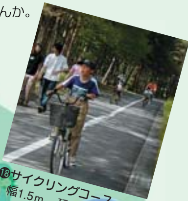
16 サイクリングコース 幅1.5m、延長1.4kmの林間を走るコース