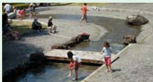
3 溪流ひろば きれいな溪流があり、水遊びのできるひろば