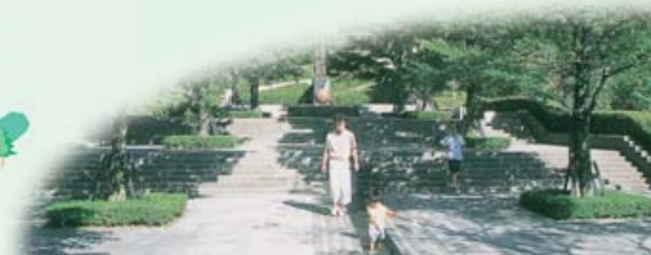
1 中央ひろば 公園の案内や管理機能をもった表玄関