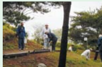
22 マレットゴルフ場 3コース、27ホール起伏に富んだ林間コース