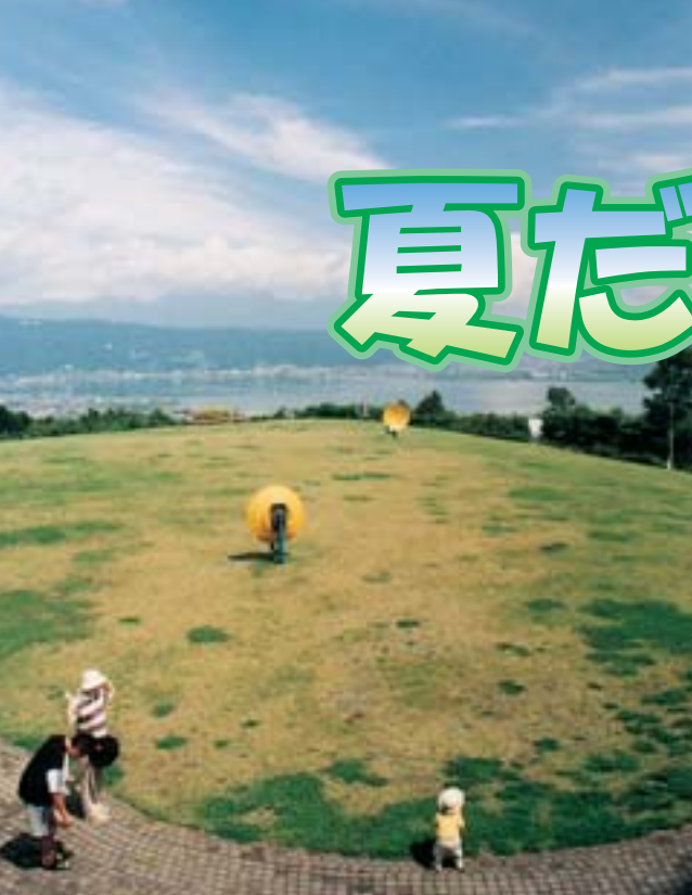
⑧展望ひろば 八ヶ岳・諏訪湖を一望できる絶景のひろば