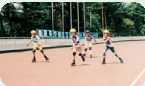
19 ローラースケート場 200mのスピードコース（日本最大）とローラーホッケーリンク