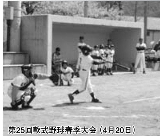
第25回軟式野球春季大会(4月20日)