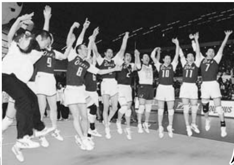
優勝が決まり、喜びあう選手たち