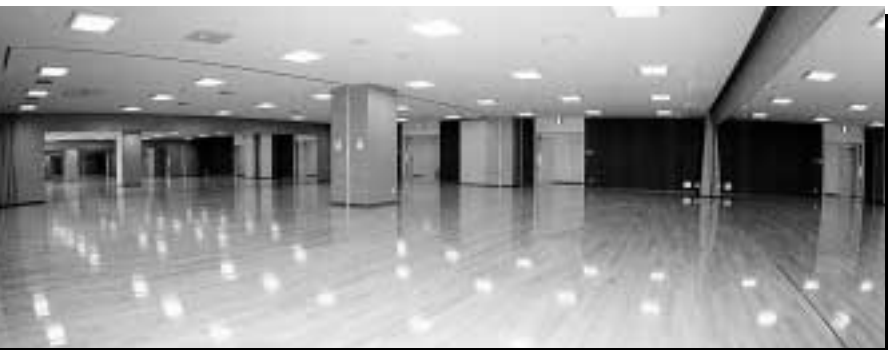
3F ダンス・音楽室 鏡が2面壁にあり、2室に仕切れます