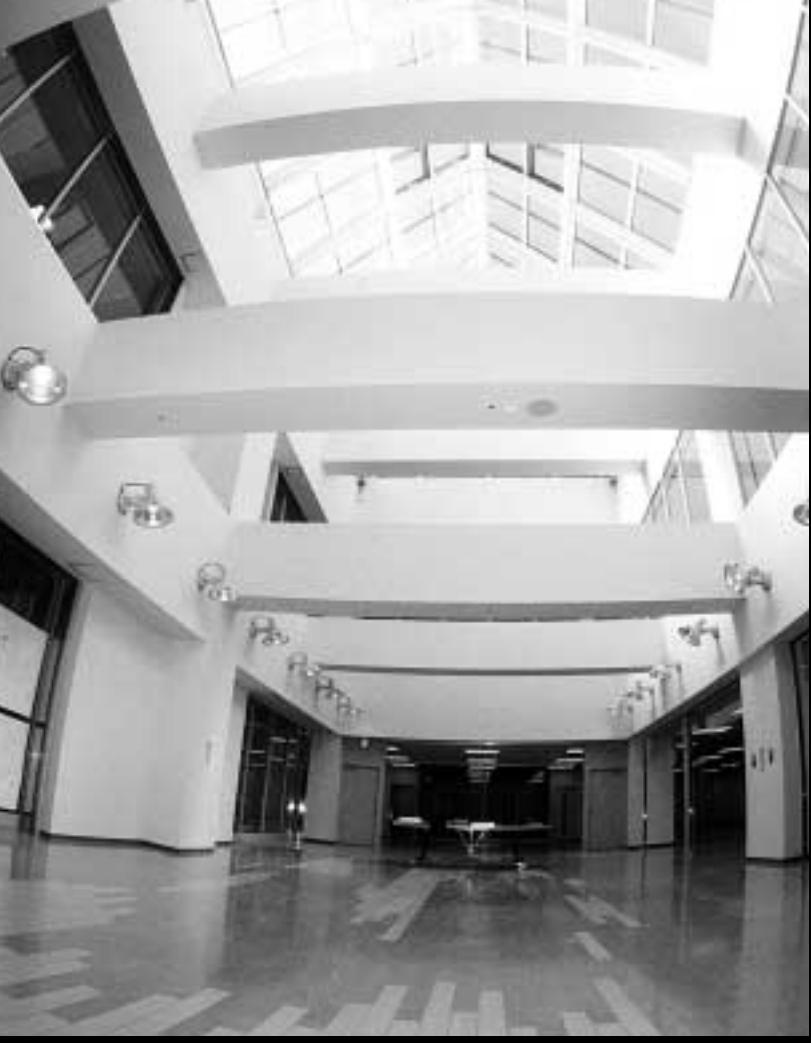
3F 催事場 屋上までの吹抜で自然採光です