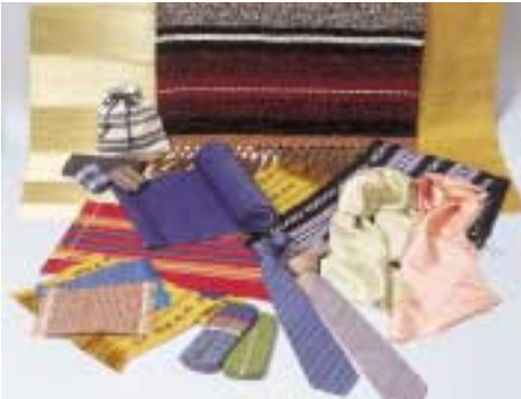
見て、ふれて感じる―「おかや絹」