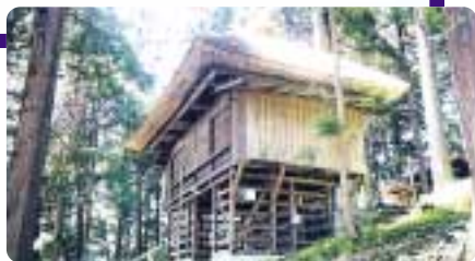
今井十五社 くぐり舞屋