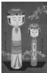
▲愛蔵こけし図譜 熱海・玉山（福島）

12月21日（日）1階はらっぱにて、午後2時よりクリスマス会を行います。楽しいイベントがいっぱいです。ラムラム・サンタに会いに来てください。