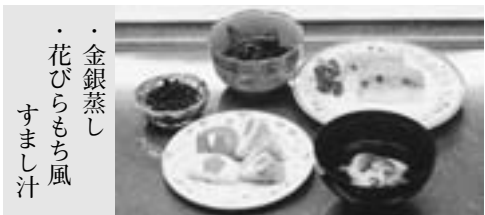
金銀蒸し 花びらもち風 すまし汁

今回から、食改員のおすすめレシピを紹介 していきますので、ぜひ、作ってみてくださ い。初回は、お正月の料理です。手作りのみ だと大変ですが、市販品も上手に使って、メ リハリをつけると良いですね。