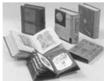
標の会のアルバム

本の宝石139冊、本の住む城21箱を一挙にご鑑賞いただける貴重な機会も、会期が残りわずかとなりました。ぜひご来館いただき、武井ワールドをお楽しみください。