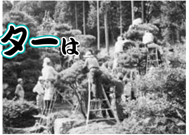
植木せん定技能講習会のようす