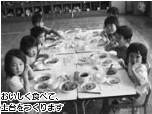
みんなでおいしく食べて、 心や体の土台をつくります