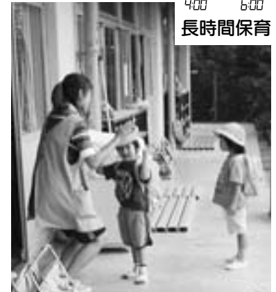
バイバイ！またあした...