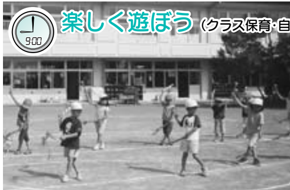
運動会のおどりの練習をしました