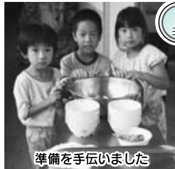
準備を手伝いました