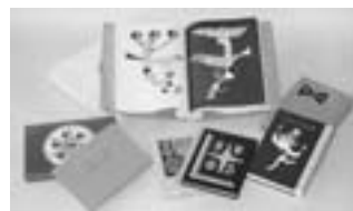
（武井武雄刊本作品）

※問合せ…イルフ童画館（☎24-3319・FAX21-1620）〔毎週木曜定休〕