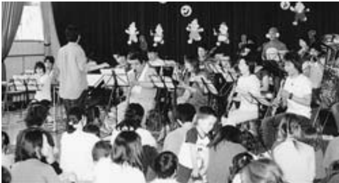
▲吹奏楽グループ (あんこ〜る)