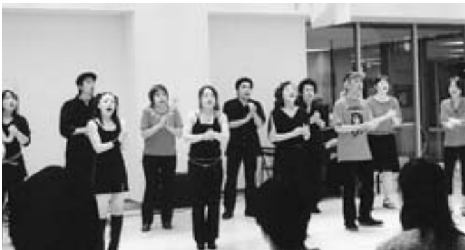
▲ゴスペルグループ (B.O.C)