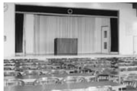
◀ 勤労会館大会議室