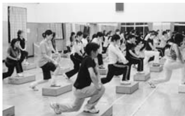
▲ステップ・エクササイズ