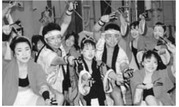
▲チーム名「みんなこい勤青」 “わっさか賞” を受賞