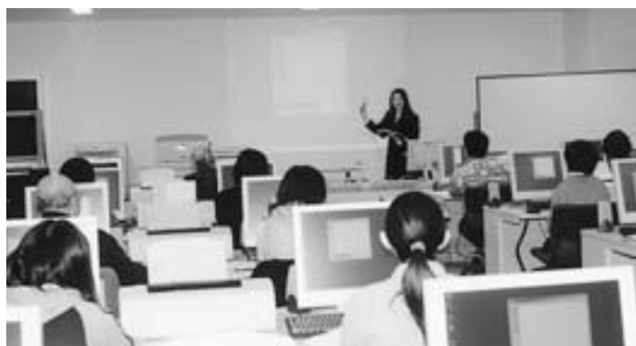
▲「デジカメ」をパソコンで活用してみよう！