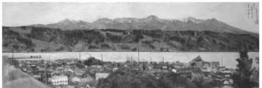
初夏岡谷風景 高橋貞一郎 1949年