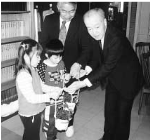
湊小学校児童に花鉢を贈呈 (4月26日)