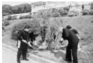
上の原小学校へ市花を植樹 (5月9日)