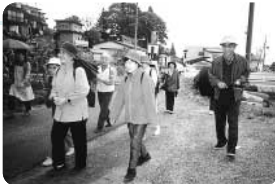
楽しく歩け歩け！（中屋地区社協）

5つの行事【①歩け歩け②手芸③マレットゴルフ④囲碁・将棋・マージャン⑤温泉・お寺・遺蹟巡り】を月に1～2回行っており、子どもから高齢者まで誰でも参加できます。