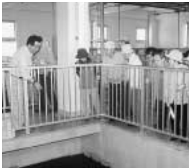
先月の施設見学会のようす (小井川水源にて)