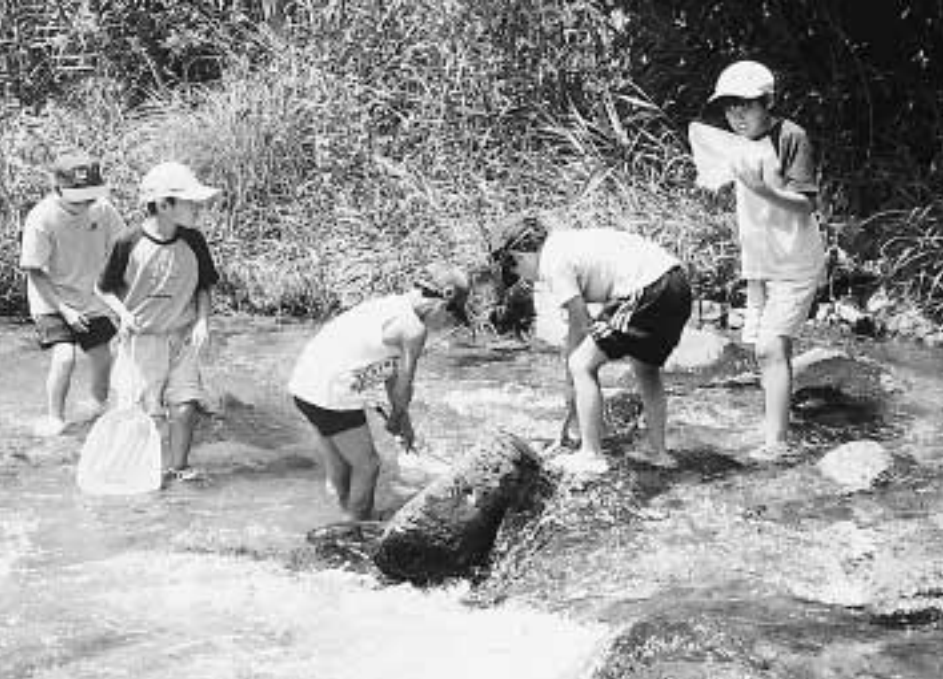
(昨年の水生生物観察会のようす)