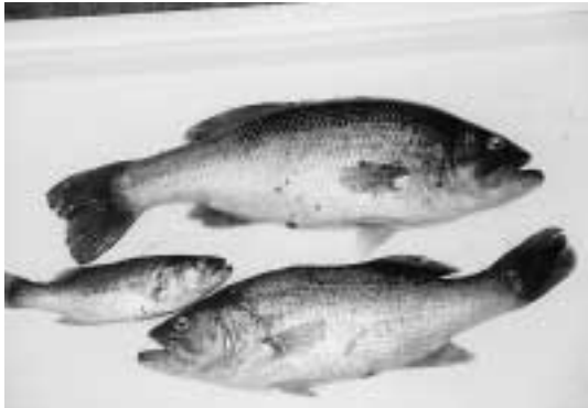
捕獲されたブラックバス

ブラックバスは、在来魚に比べ圧倒的に魚食性が強く繁殖力も旺盛でほかの水生生物を捕食し漁業に与える影響が大きいため、県の漁業調整規則で無許可の放流と生きたままでの持ち出しが禁止されています。