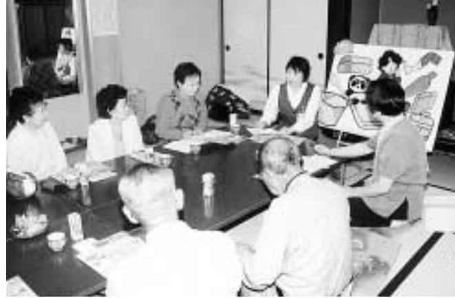
6月10日に行われた「かしこい消費者」講座のようす