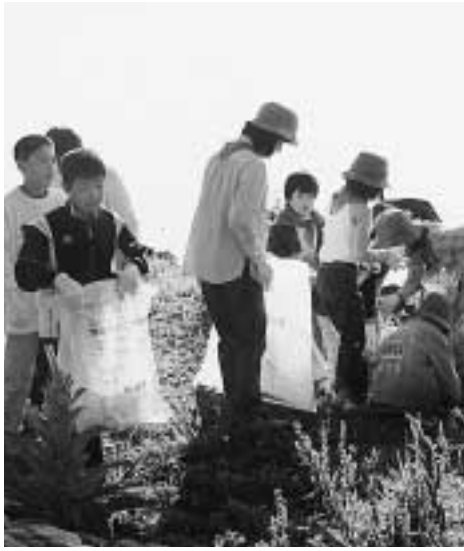
昨年の諏訪湖清掃のようす