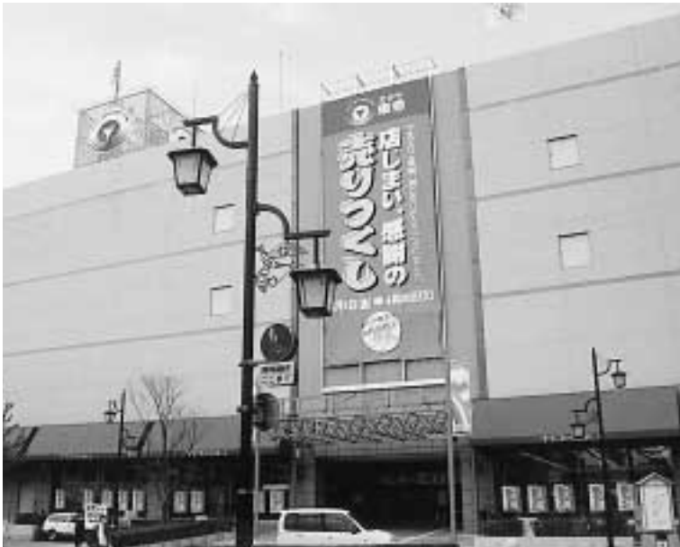
4月30日をもって閉店。6月上旬に1・2階リニューアルオープンを目指す

岡谷市役所 企画課 ☎234811 内線1523 FAX240689 Eメール kk@city.okaya.nagano.jp