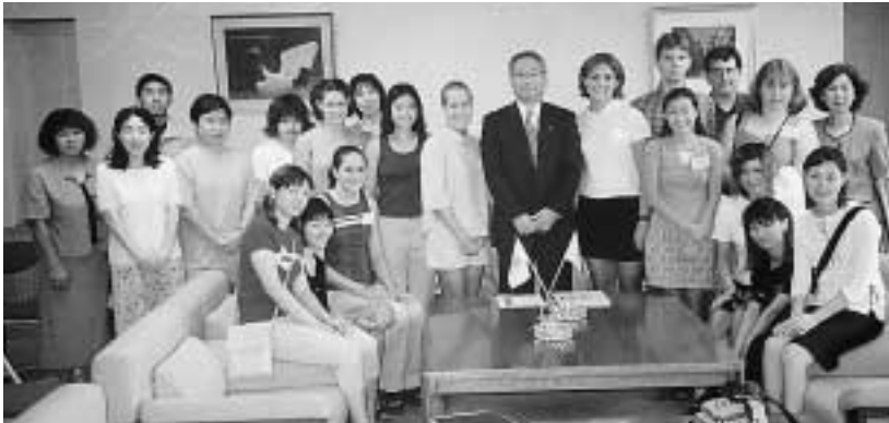
昨年の訪問高校生とホストファミリー