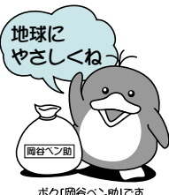
ボク(岡谷ペン)だよ