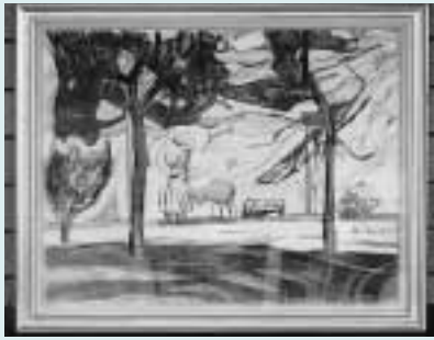
高橋 靖夫 「地にあるものたち春」テンペラ