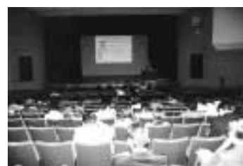
昨年の大会のようす