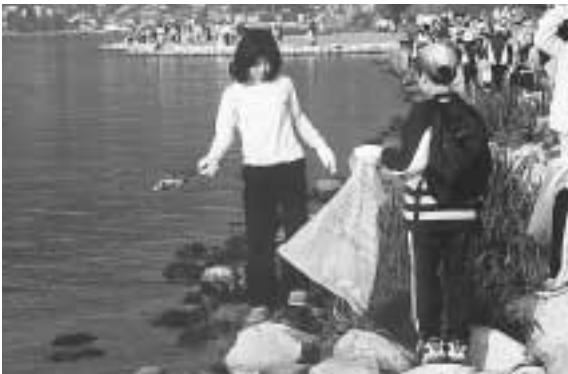
諏訪湖清掃のようす