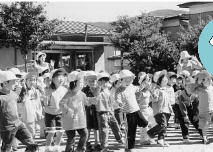
東堀保育園（運動会の練習のようす）