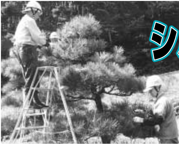
松のせん定作業のようす