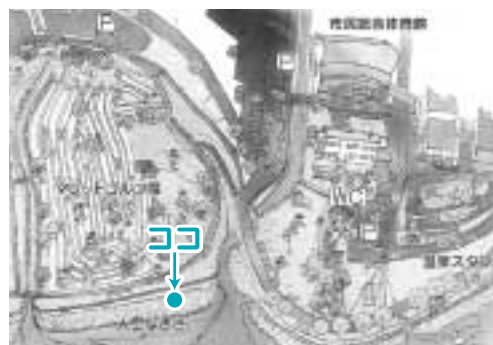
「聖なる儀式」と「日の出の儀式」を行う場所